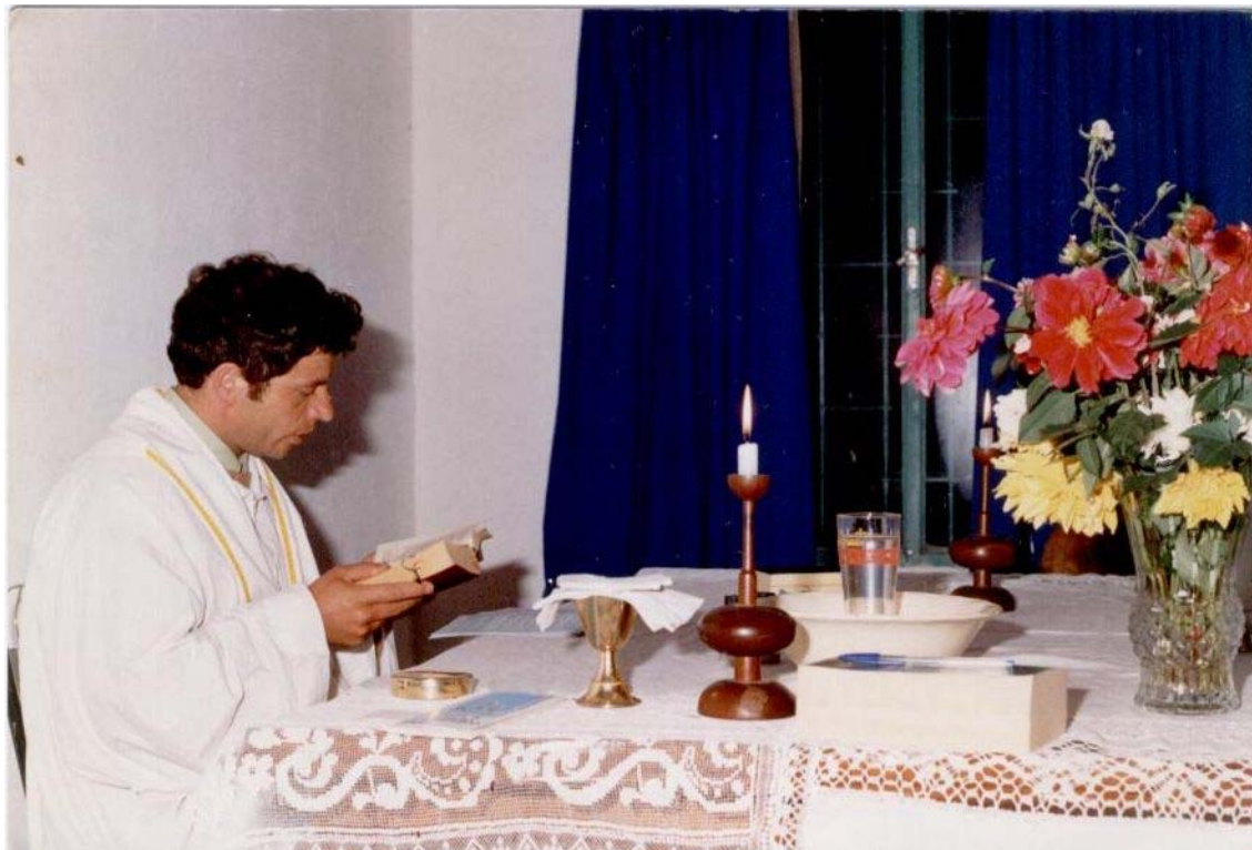
La celebrazione del mistero eucaristico, anche su di un'altare di fortuna, nulla perde in valore, dignità e bellezza