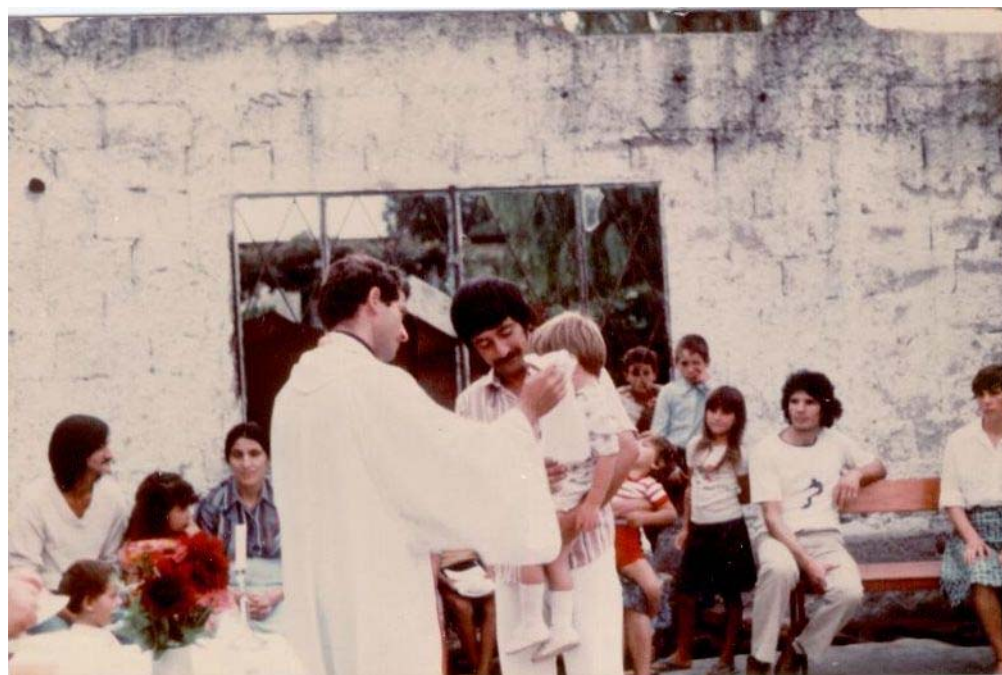
Somministrazione del Sacramento del Battesimo ai bambini della missione